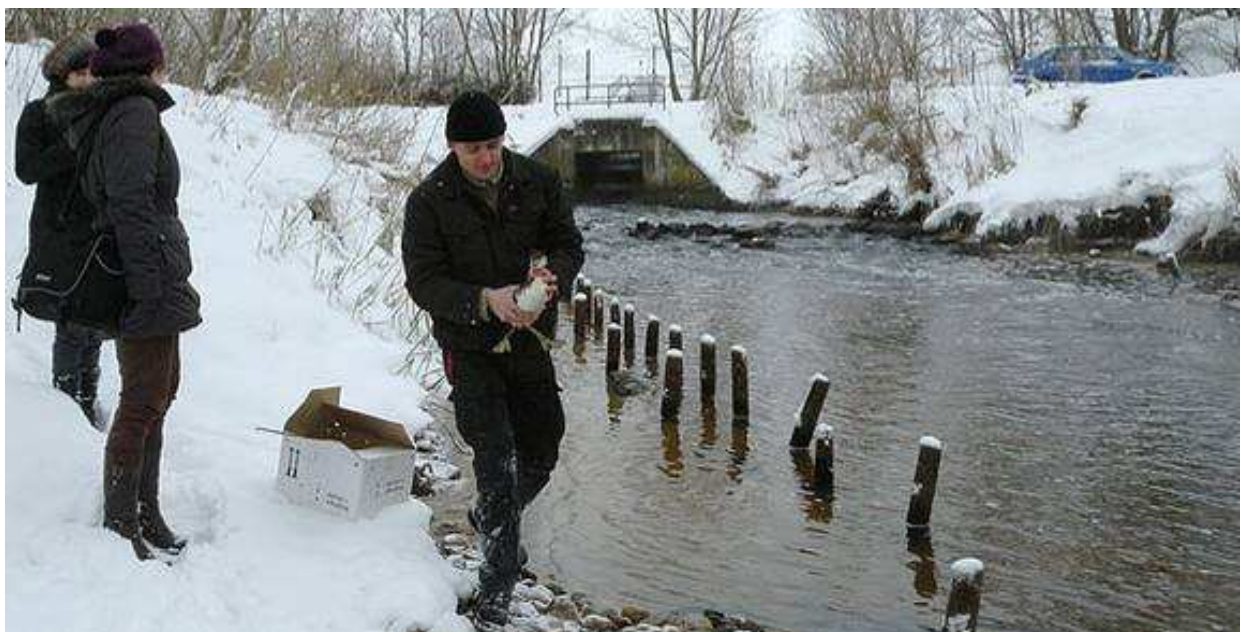
Perkoz dwuczuby Podiceps cristatus który wyladował 29.01.2010 na podwórku u rolnika w Czeremsze został przetransportowany nad rz. Białą koło Białegostoku