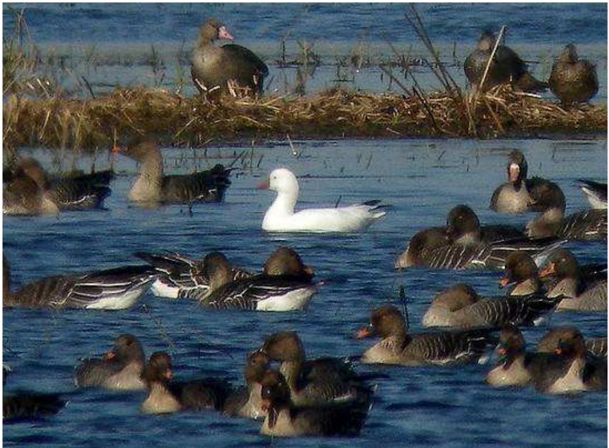
Śnieżycza mała Anser rossii na rozlewiskach koło Wizny 26.04.2010