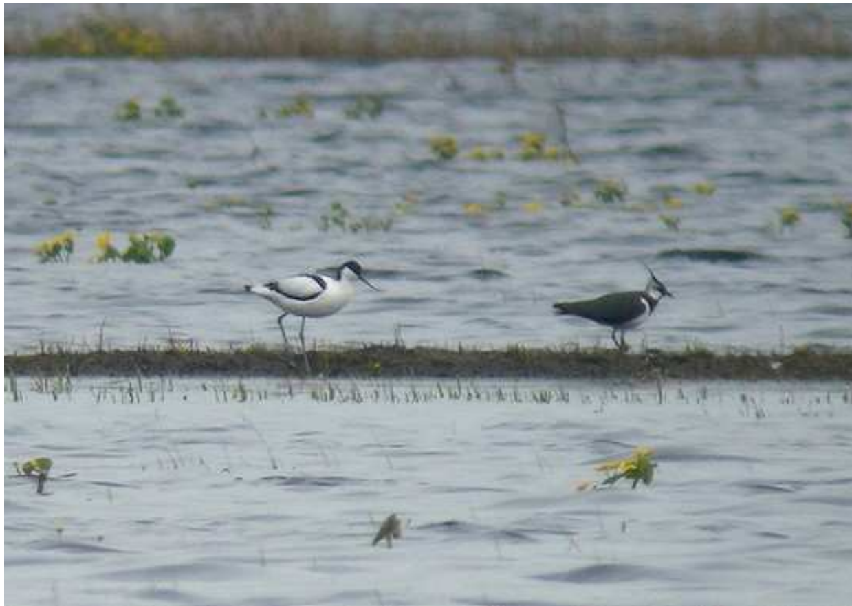
Żerujący szablodziób nad rz. Gać koło Lutostani 14.04.2010