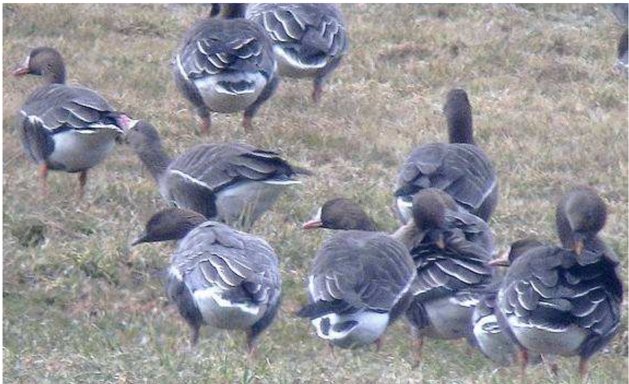
Gęś krótkodzioba koło Bożejewa 27.03.2010