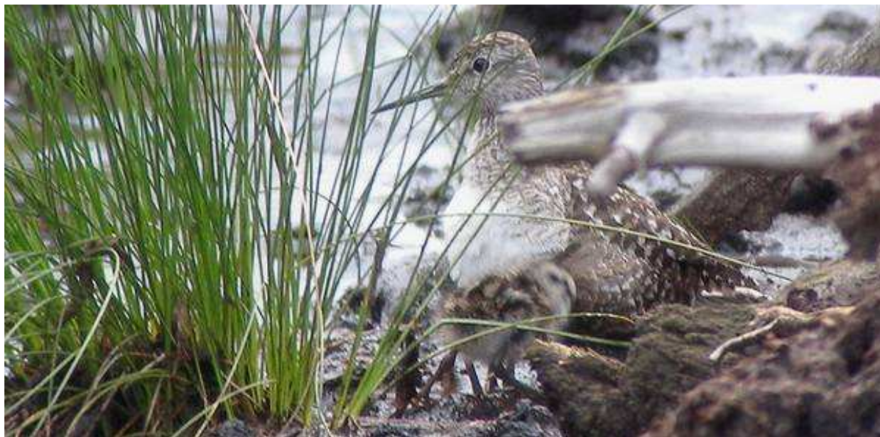
Dorosły łączak z młodymi 22.06.2010