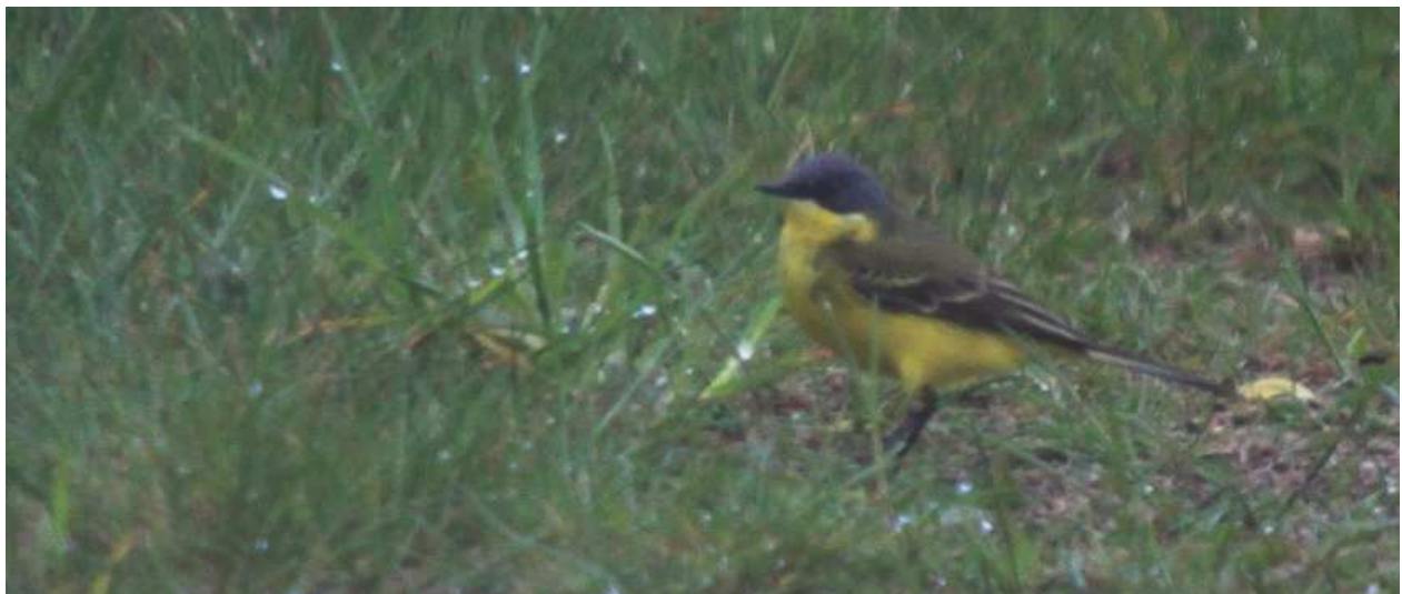
Samiec pliszki tundrowej w Zajkach (podgatunek żółtej) 06.05.2010