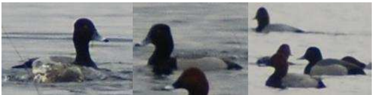
Mieszaniec głowienki z czernicą

30.03 - 1 ♂ mieszaniec, Wizna (gm.), pow. łomżyński (P. Białomyzy, A. Zakrzewska).