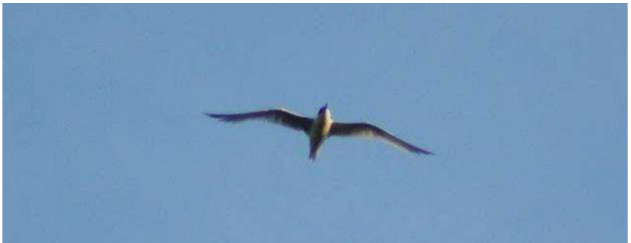
Zaledwie drugie stwierdzenie tego gatunku w regionie 13.08.2010 Zb. Siemianówka