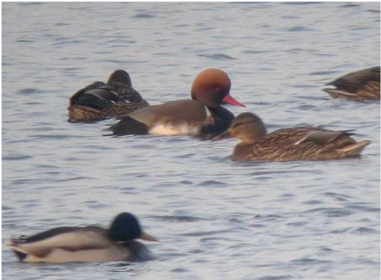
Samiec hełmiatki na nieczynnych odstojnikach cukrowni w Łapach 27.11.2010