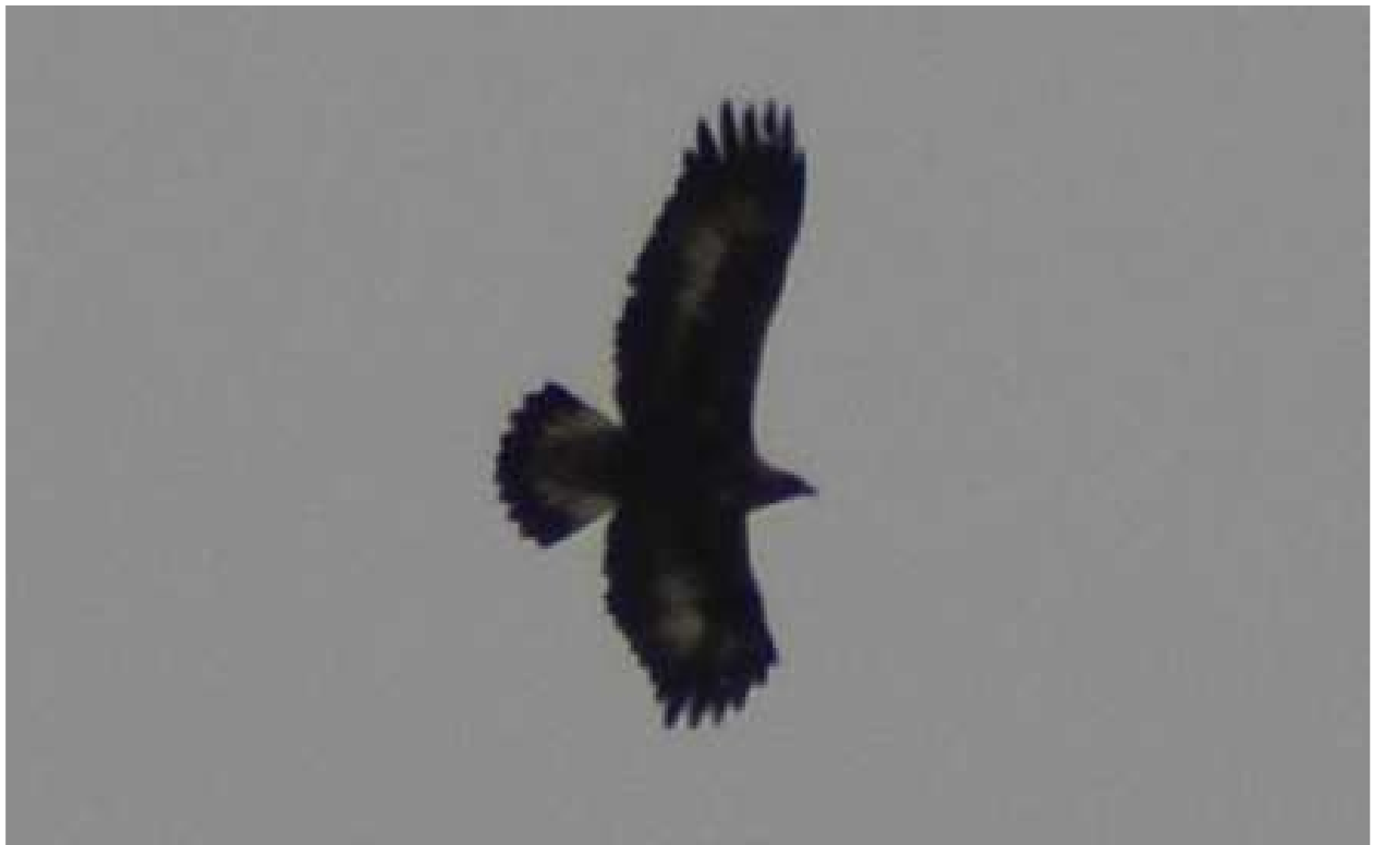
Młody orzeł przedni w okolicach Krynek 28.11.2010