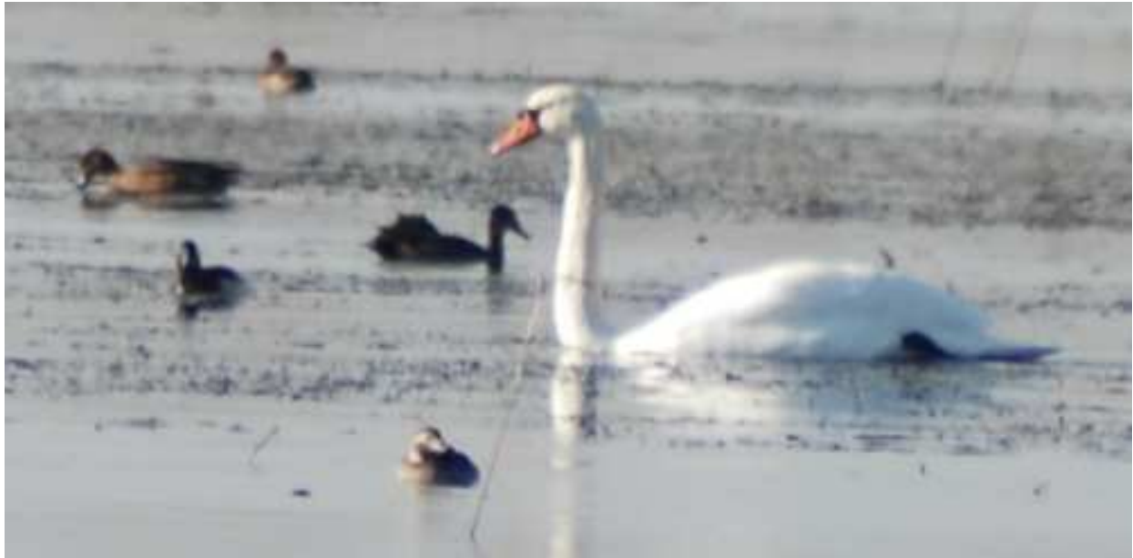
Samica lodówki na Zb. Siemianówka

01.11.11 - 1 ♀/im., Zb. Siemianówka (P. Białomyzy).