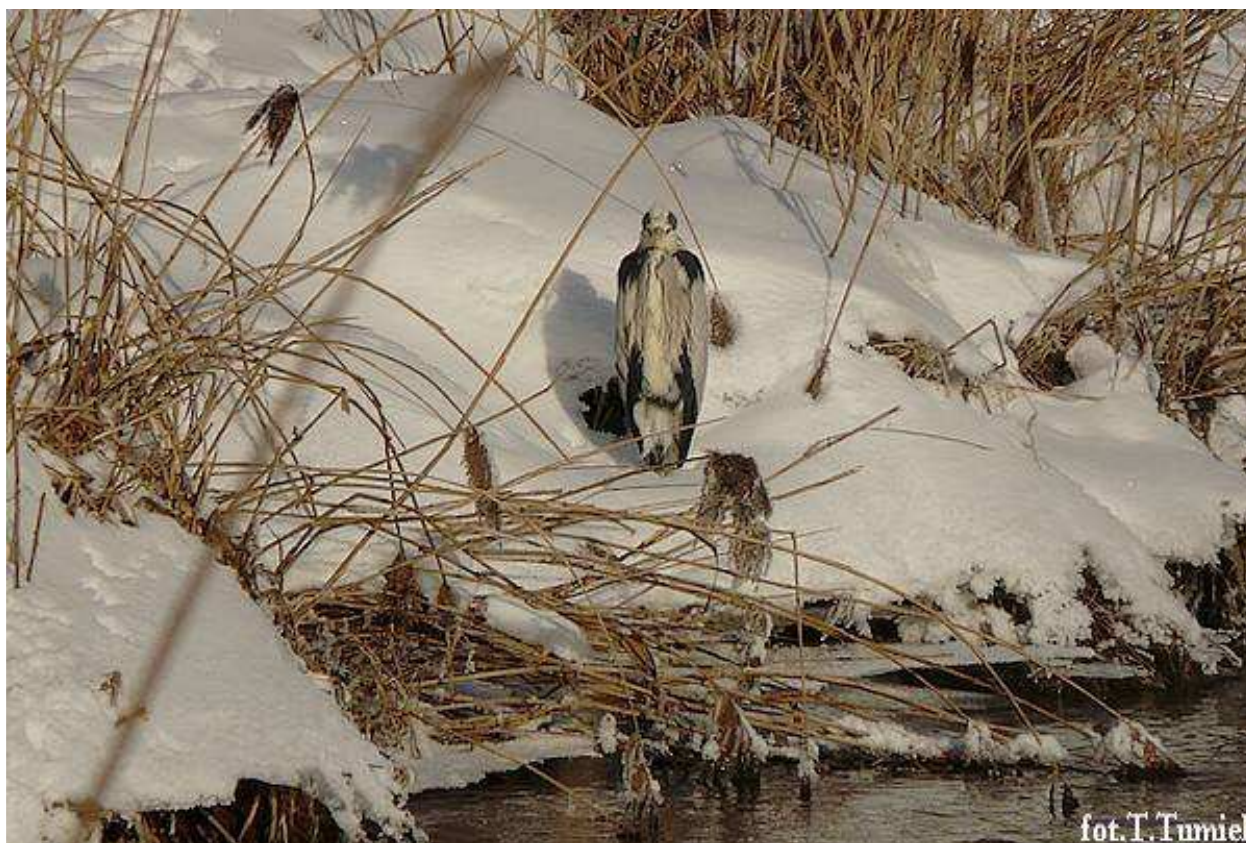
Sporadycznie można spotkać zimująca czaple siwą 23.01.2010 Białostocka oczyszczalnia ścieków