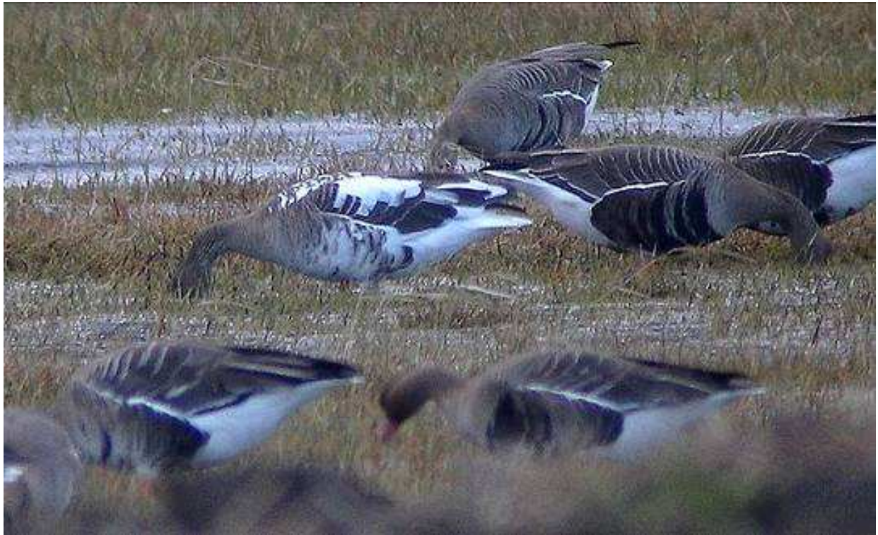
Leucystyczna gęś białoczelna koło Płochowa

27.03 - 1 leucystyczna, Płochowo, gm. Goniądz, pow. moniecki (G. Grygoruk, W. Piechowski).