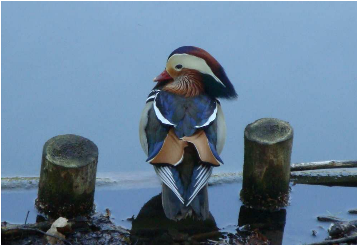
Samiec mandarynki nad J. Tajno, fot. Ż. Trzemęska

03.05 - 1, J. Tajno, gm. Bargłów Kościelny, pow. augustowski (Ż. Trzemęska).