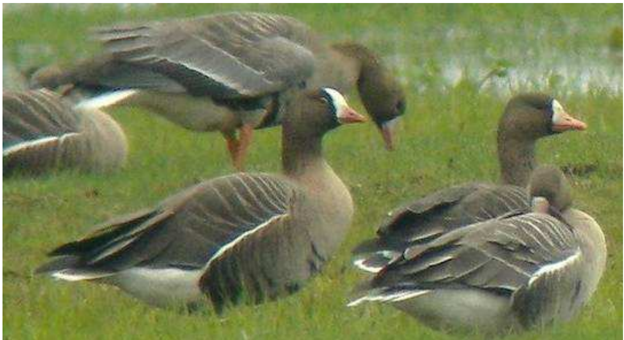
Gęś mała koło Suraża 07.04.2010