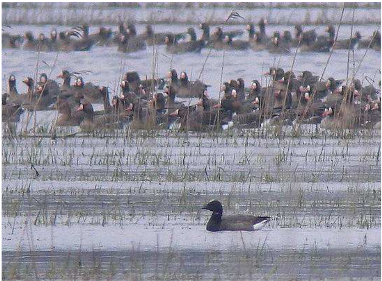
Bernikla obrożna odpoczywająca koło Grądów Woniecka 03.04.2010