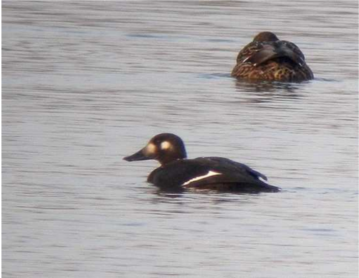
Samica uhli na nieczynnych odstojnikach cukrowni w Łapach 27.11.2010