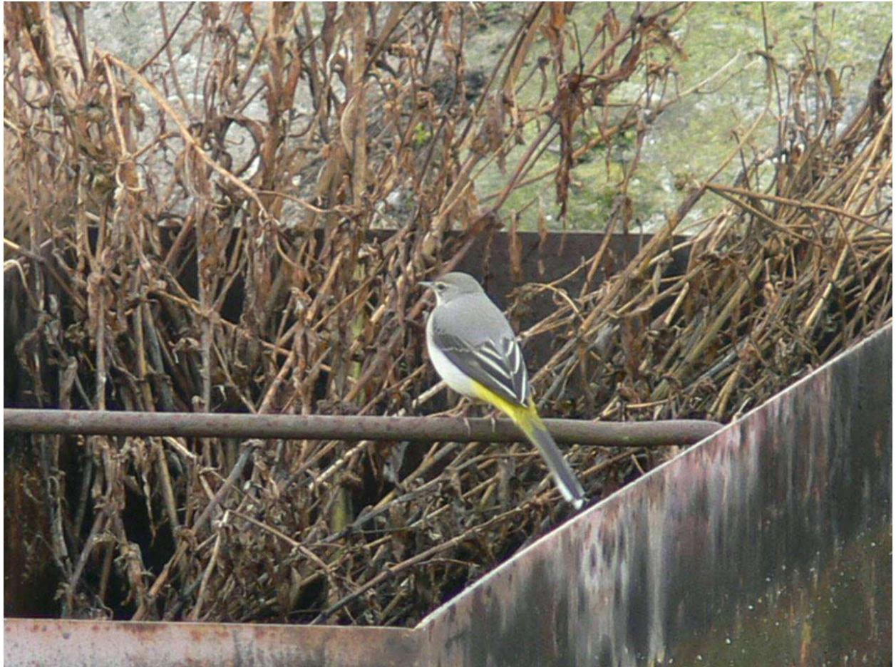
Pliszka górska obserwowana na oczyszczalni ścieków w Hajnówce 27.10.2012