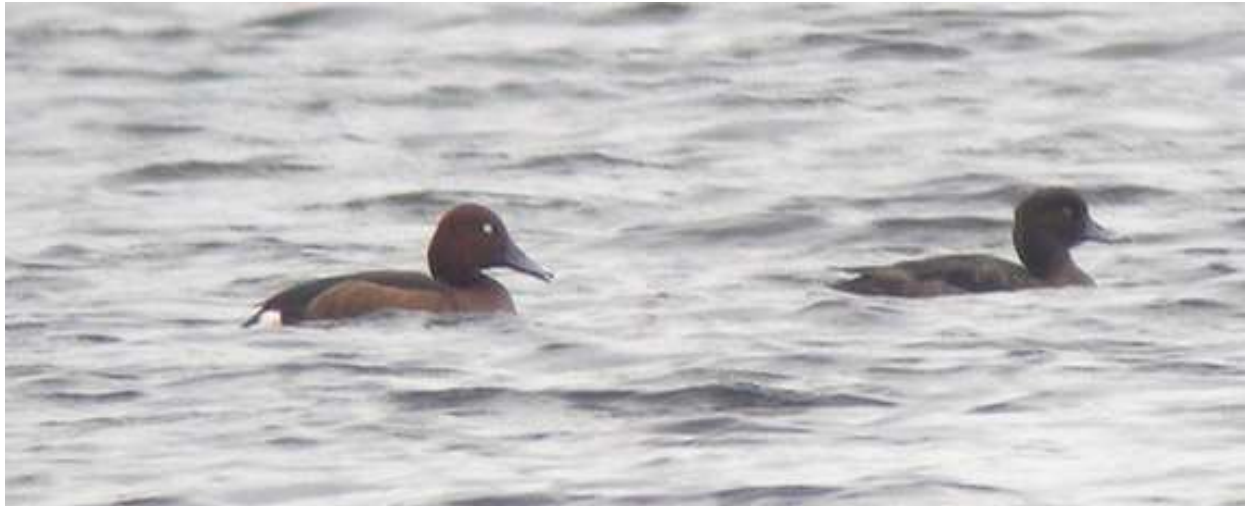
Samiec podgorzałki na St. Dojlidzkich w Białymstoku 03.05.2010