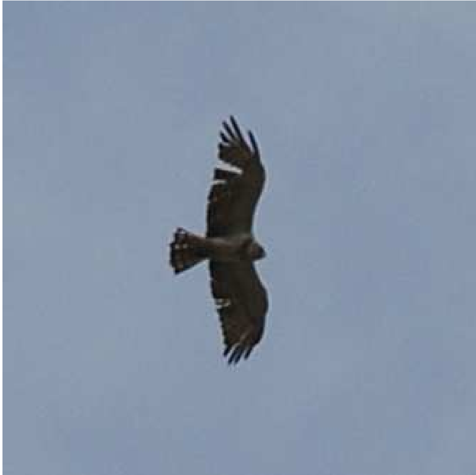
Przelotny gadożer koło Borek 16.05.2010