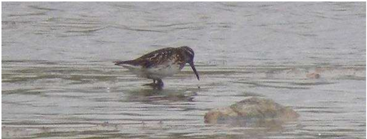
Biegus płaskodzioby na ostojnikach cukrowni w Łapach 29.07.2010