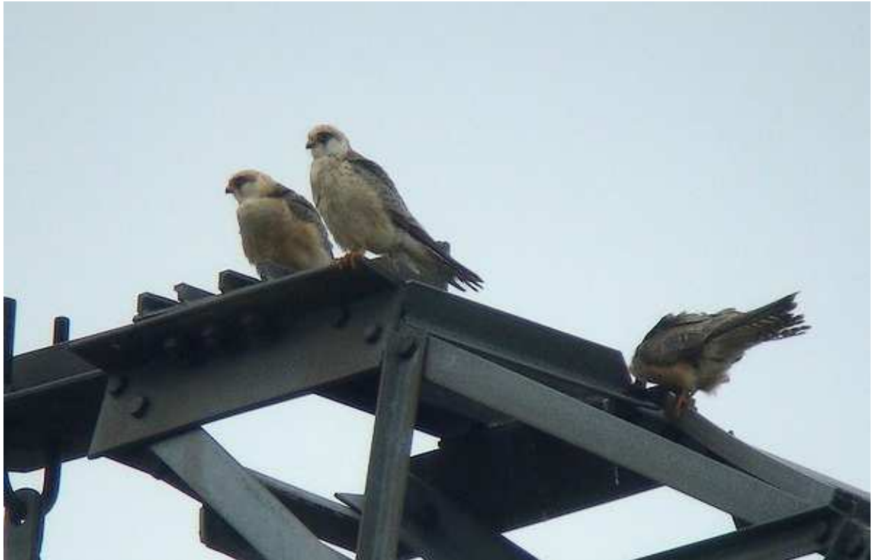
Kobczyki odpoczywające koło Suraża 15.05.2010