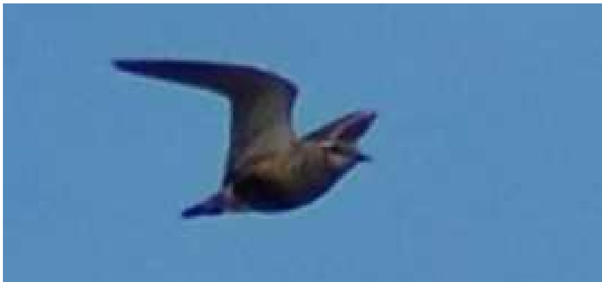
Przelatujący mornel nad polami koło Krynek 20.09.2010