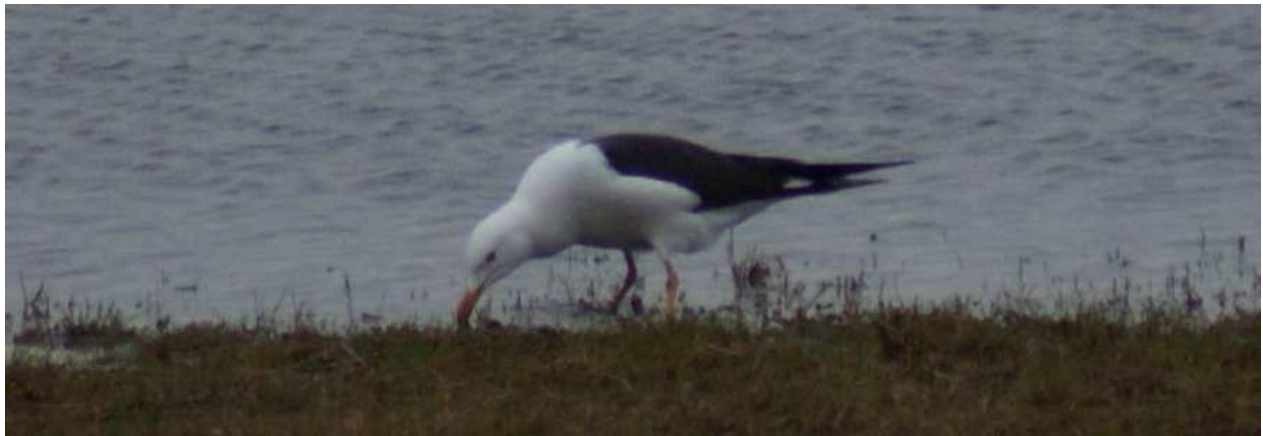
Dorosła mewa żółtonoga Larus fuscus koło Laskowca nad rz. Narew z 27.03