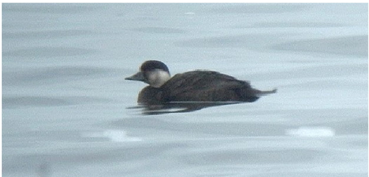
Samica markaczki na Zb. Siemianówka 08.11.2010