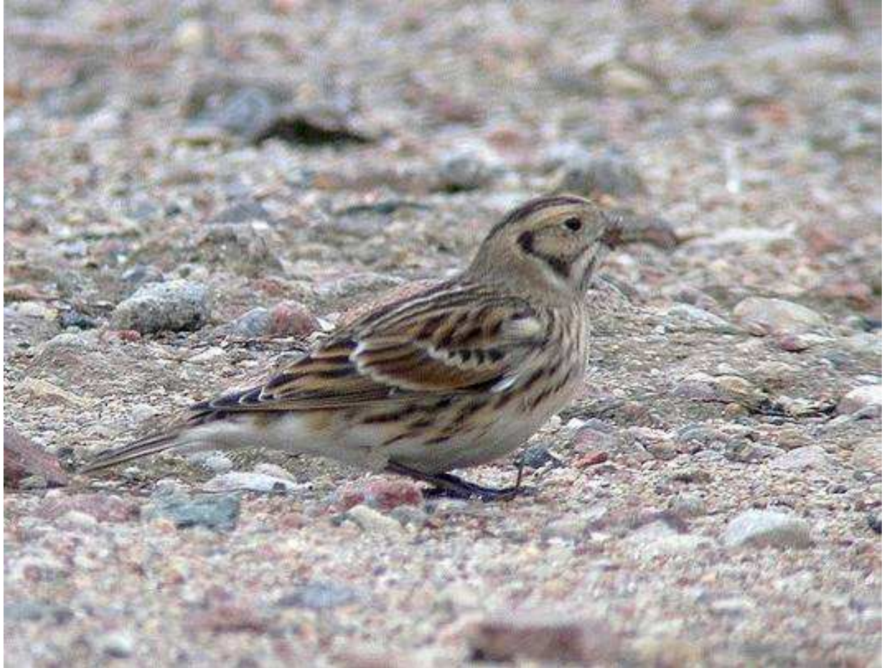
Żerująca poławierka na lotnisku Krywlany w Białymstoku 13.11.2010