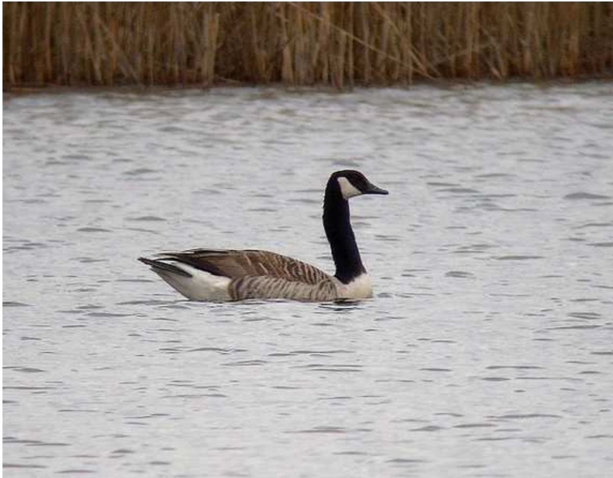
Bernikla kanadyjska na St. Popielewo, fot. G. Grygoruk

16.04 - 1, St. Popielewo, gm. Krypno, pow. moniecki (G. Grygoruk).