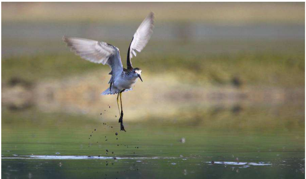
Startujący brodziec pławny z odstożników nieczynnej cukrowni w Łapach 31.07.2010