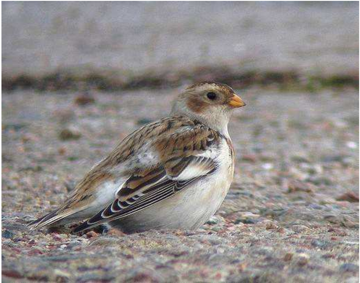
Żerująca śnieguła na lotnisku Krywlany w Białymstoku 13.11.2010