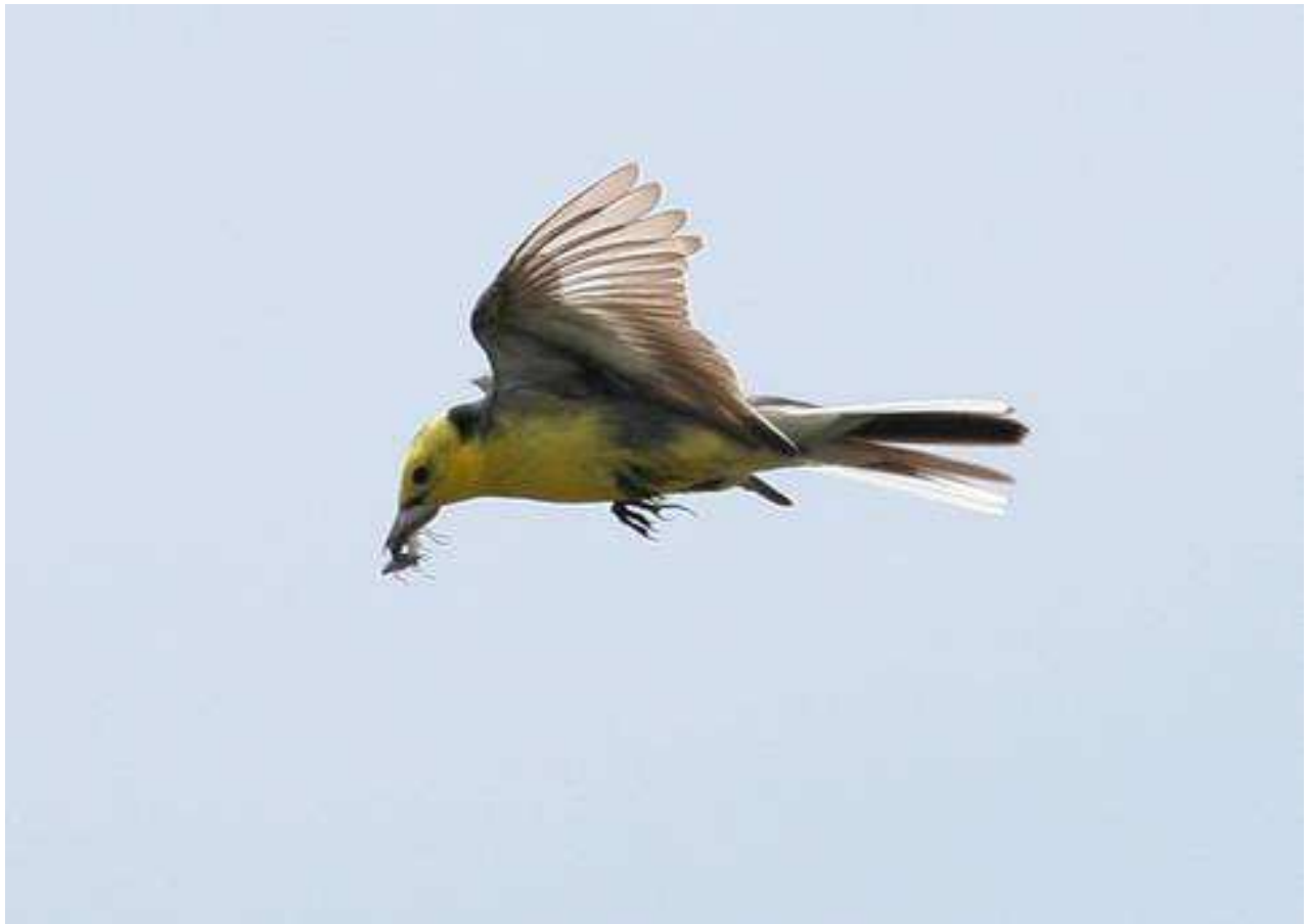
Lęgowa pliszka cytrynowa na stawach Waliły-Dwór 31.05.2010