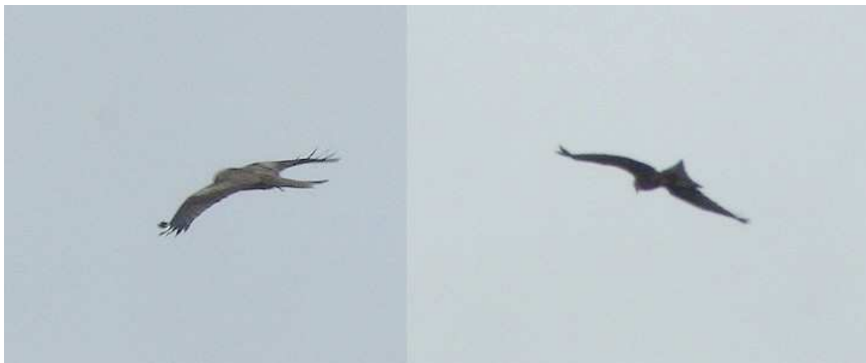
Przelotnia kania czarna koło Wrocenia 11.04.2010