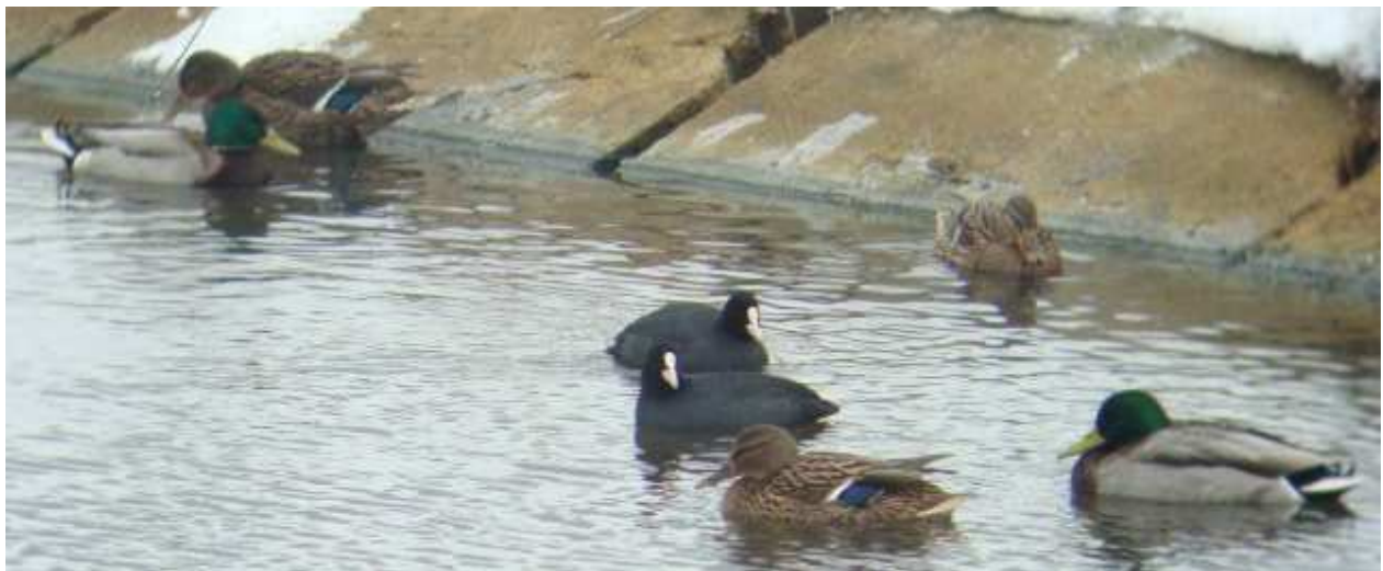
Nie co roku można spotkać w naszym regionie zimujące łyski, 17.01.2010 Hajnówka