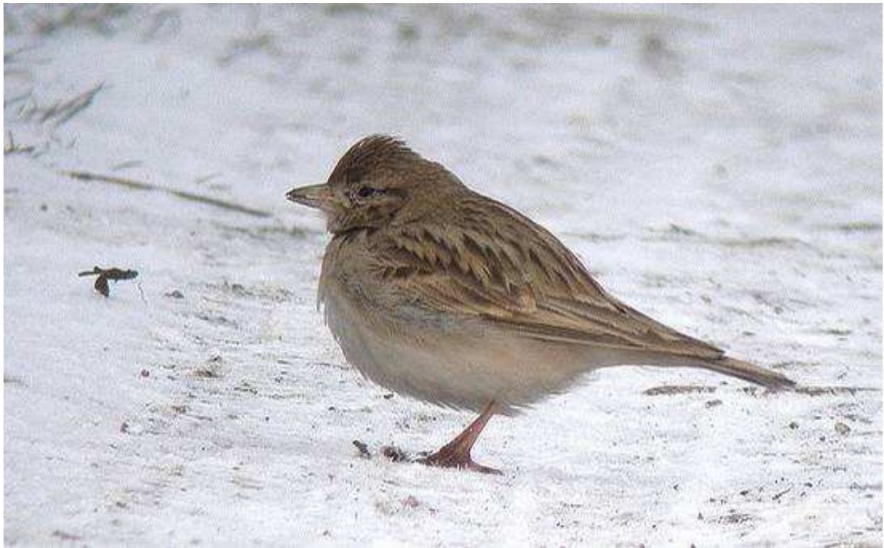
Skowrończyk krótkopalcowy w nietypowej zimowej scenerii Białystok-Krywlany 28.11.2010