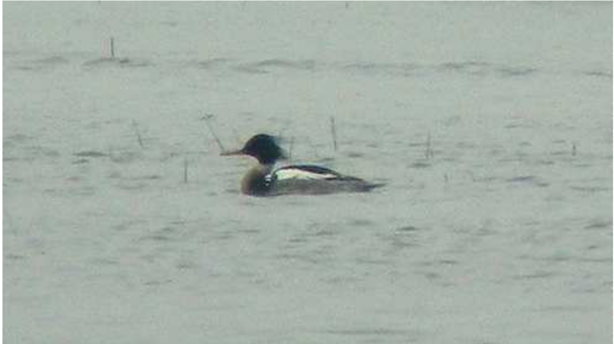
Samiec szlachara koło Końcowizny 07.04.2010