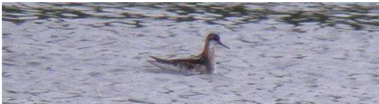
Płatkonóg szydłodzioby na ostojnikach cukrowni w Łapach 29.07.2010