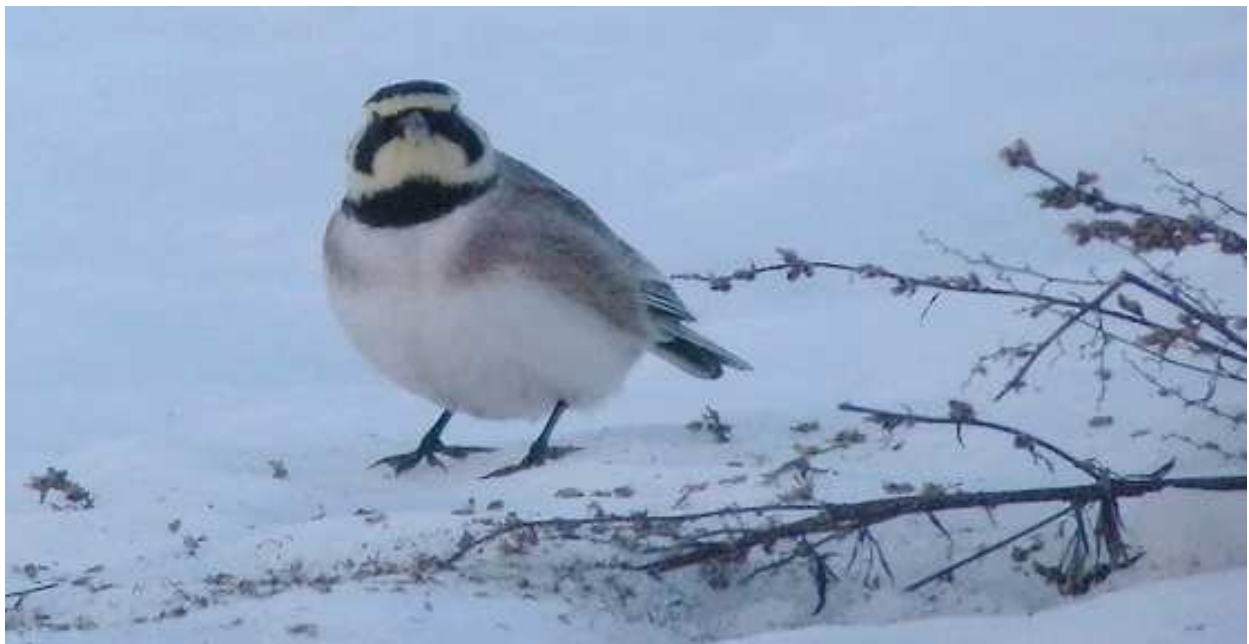
Żerujący górniczek koło Tykocina 22.02.2010