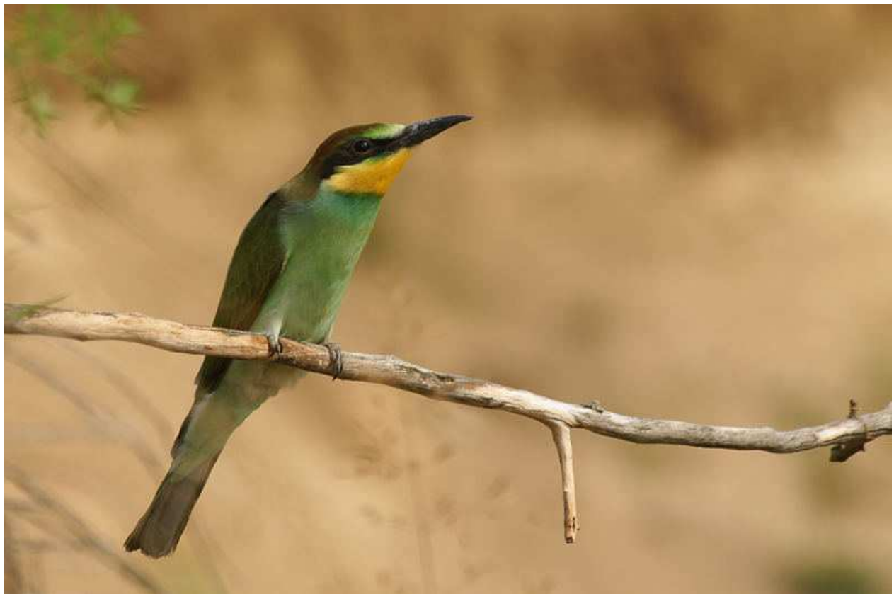
Młoda żoła koło Wysokiego Mazowieckiego 07.08.2010