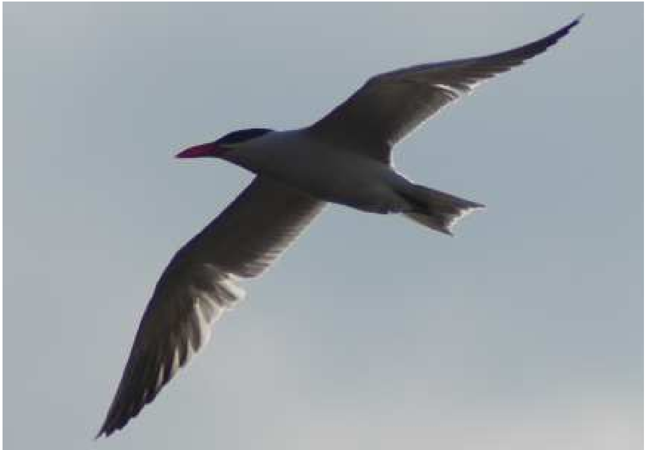
Dorośla rybitwa wielkodzioba Zbiornik Siemianówka 11.04.2010