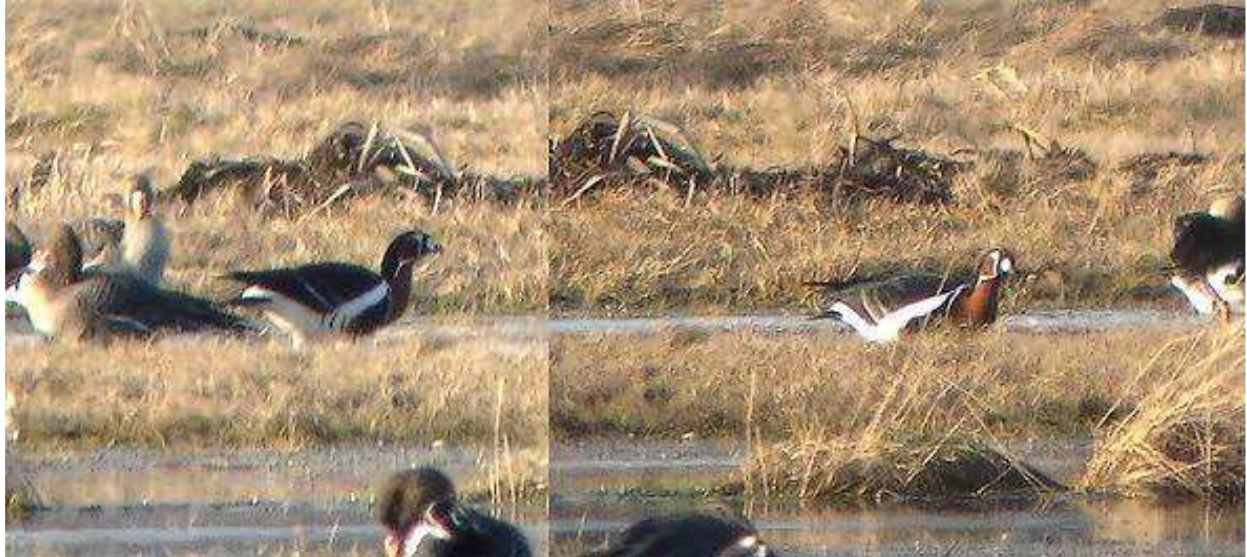
Bernikla rdzawoszyja koło Płochowa 24.03.2010