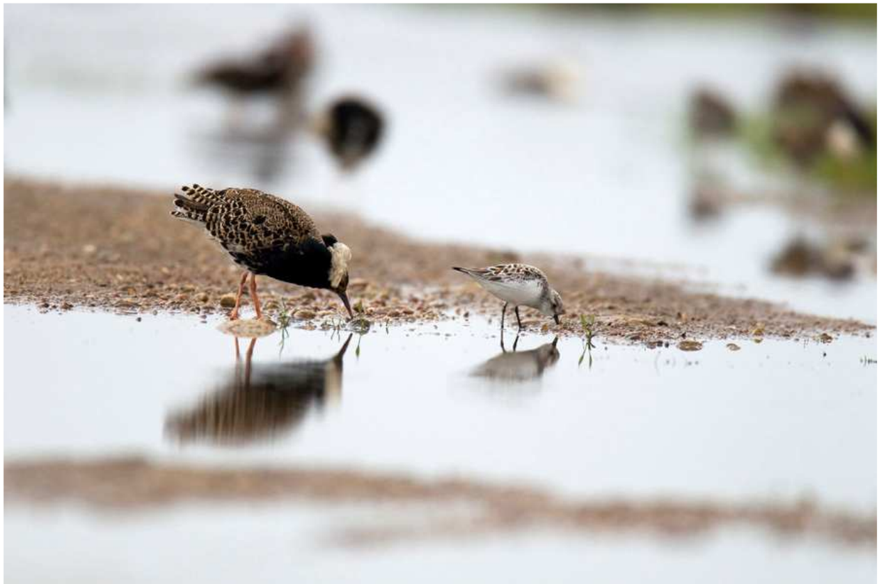
Piaskowiec w towarzystwie samca bataliona 02.05.2010 koło Grądów Woniecka