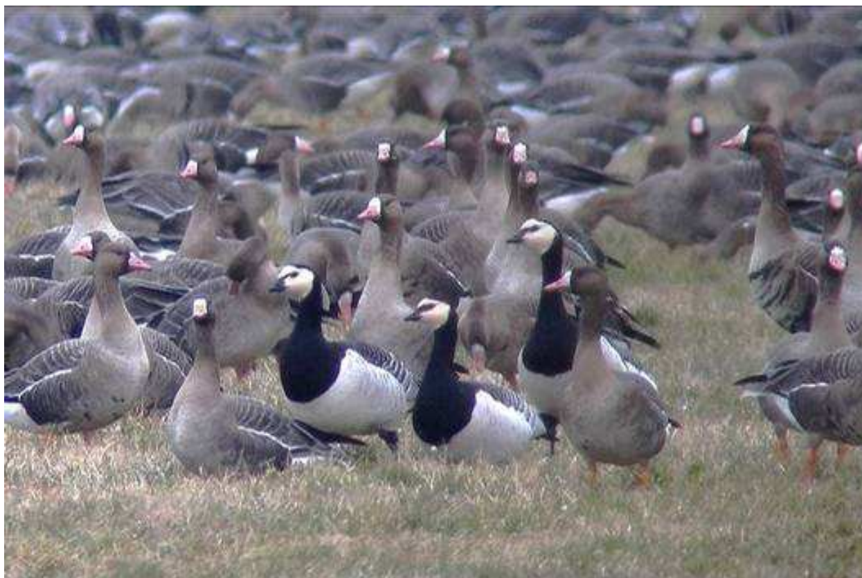
Bernikle białolice żerujące koło Grądów Woniecka 03.04.2010